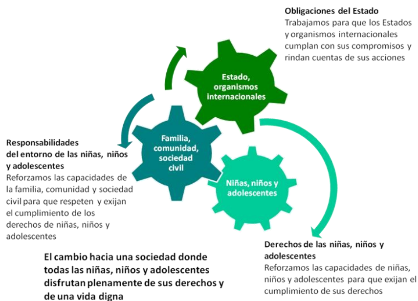
Diagrama 1: El Enfoque de Cambio de Educo

Todos y cada uno de estos actores deben ser, en la esfera que les corresponda, agentes del cambio deseado, mediante acciones directas sobre las carencias y las violaciones de derechos, el refuerzo de los mecanismos institucionales y el de las capacidades de las comunidades y de la sociedad civil. El papel que juegan las niñas, niños y adolescentes, es decir, su grado de implicación y responsabilidades, varía según su estado de desarrollo evolutivo.